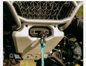
WINCH DE 3,500L