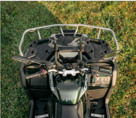
DIRECCIÓN ELECTRÓNICA ASISTIDA