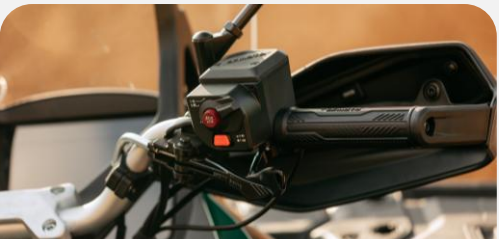
TRANSMISIÓN, BLOQUEO DE DIFERENCIAL 4X4