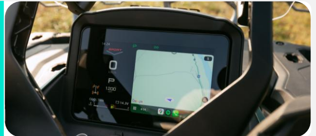
Pantalla TFT 7" BLUETOOTH