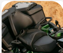
DISPOSICIÓN 2 PERSONAS