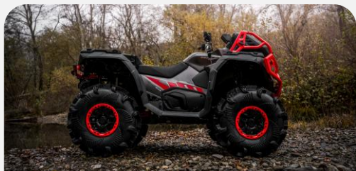
NEUMÁTICOS DE 30" PARA BARRO