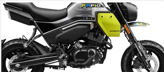
MOTOR MONOCILÍNDRICO DE 124 CC DOHC