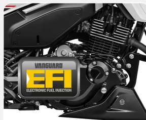
SIST. ELECTRÓNICO DE INYECCIÓN EFI