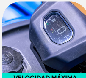
VELOCIDAD MÁXIMA HASTA 45KM/H