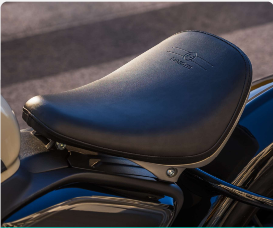
ASIENTO MONOPLAZA TIPO BOBBER

TABLERO TFT CIRCULAR DIÁMETRO 3.6" CON CONECTIVIDAD