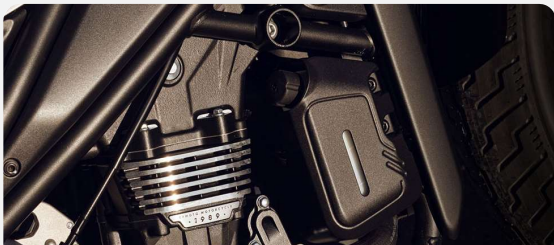
MOTOR BICILÍNDRICO DE 449 CC REFRIGERACIÓN LÍQUIDA