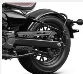
TRANSM. POTENCIA POR CORREA