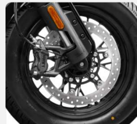
FRENOS J.JUAN CON ABS DOBLE CANAL